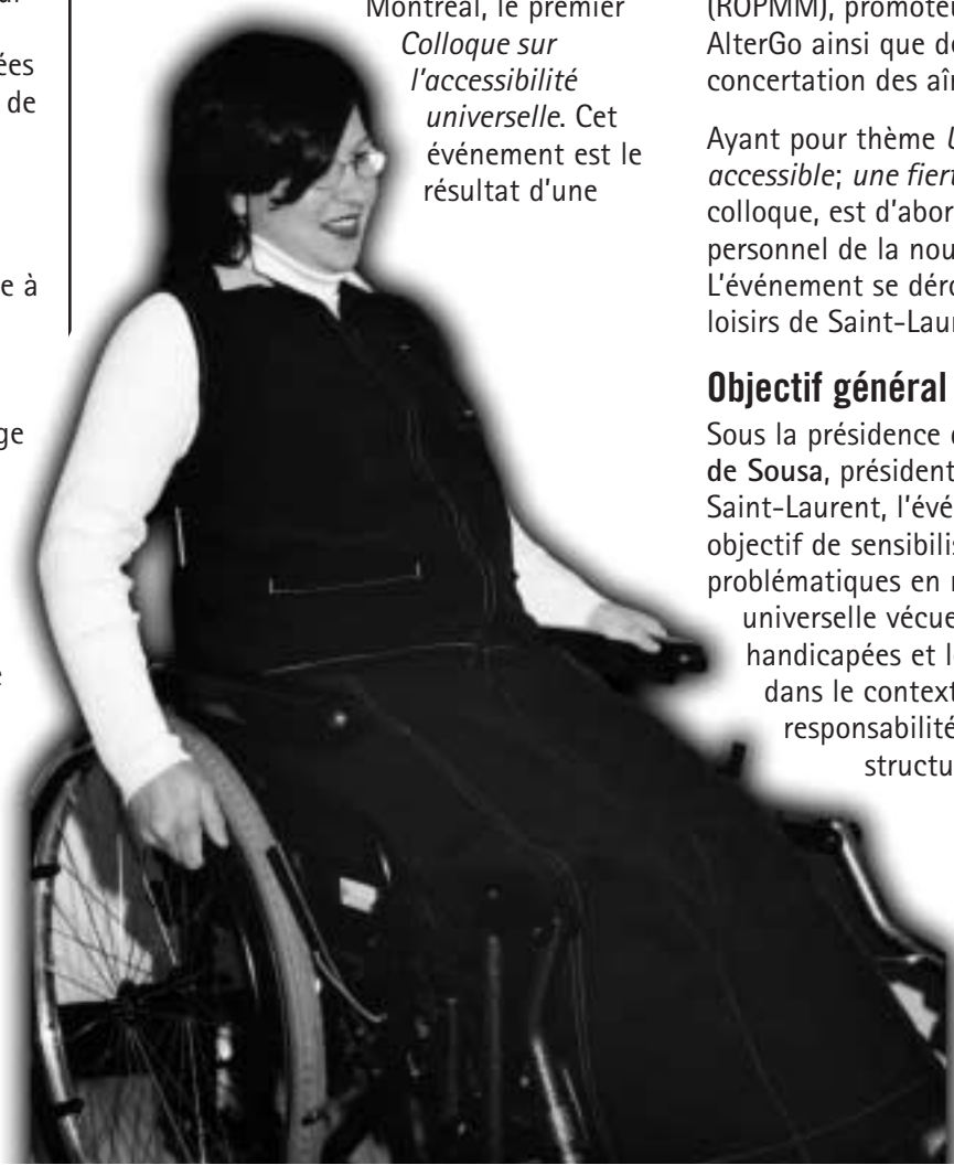
Photo prise lors d'une formation donnée par Handidactis sur l'accueil des personnes ayant une déficience.