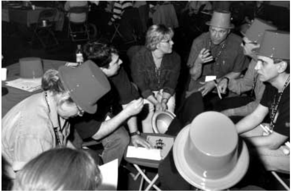
Déjà en avril 2001, la place des personnes handicapées dans la nouvelle ville de Montréal avait été le thème de la Journée des partenaires du loisir des personnes handicapées.