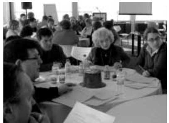
Des participants lors de la journée de réflexion à Lachine.

C'est à partir de ces propositions que les membres des deux tables de concertation se réunissaient, le 21 février dernier, pour discuter des