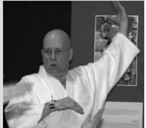
Démonstration de Nanbudo.