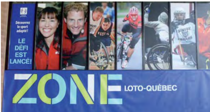
La Zone d'essais Loto-Québec aura permis aux visiteurs de découvrir plusieurs sports adaptés.

Les participants présents au Complexe sportif Claude-Robillard auront eu la chance d'expérimenter plusieurs sports adaptés grâce à la Zone d'essais sportifs Loto-Québec. Ils auront expérimenté plusieurs sports adaptés dont le basketball en fauteuil roulant, le hockey sur luge et le rugby en fauteuil. Les participants s'en sont donné à cœur joie ! Avec l'aide des guides Loto-Québec, ils ont eu la chance d'en apprendre davantage sur le sport adapté et sur les règlements de chacun d'entre eux. Nous remercions chaleureusement les bénévoles qui ont assuré le succès de cette Zone.