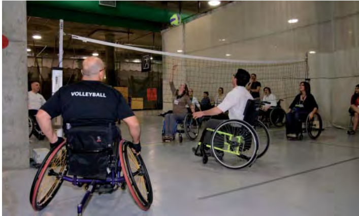
Les participants de la Journée de la réadaptation en pleine expérimentation de volleyball en fauteuil roulant

Journée de la réadaptation a eu toujours et encore un succès incontestable. Que l'on assiste à l'échauffement des escrimeurs, à une démonstration de hockey sur luge ou à une partie de rugby, quel plaisir et quelle inspiration de voir les athlètes en action et de discuter avec eux ou avec les experts pour en apprendre davantage. La relève - provenant de 54 écoles de 11 régions du Québec - était venue pratiquer leur sport dans un esprit amical. Les compétitions, c'est intéressant; la remise des médailles, c'est émouvant.