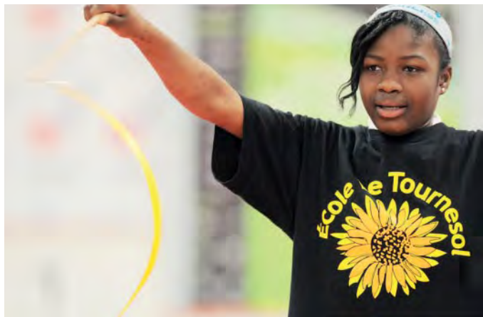
La gymnastique rythmique a fait son apparition dans la catégorie des sports scolaires cette année.

Au niveau des sports scolaires, mentionnons l'ajout au programme de la gymnastique rythmique pour les jeunes