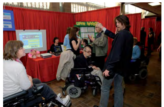
La visite du Boulevard PANAM a été une activité des plus enrichissantes pour les participants.

Un habitué – et un partenaire – de la Journée, Gérald Tremblay, maire de Montréal a, par la suite, fait le tour des