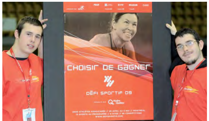
Merci à tous les bénévoles pour votre participation tant appréciée !

900 fois merci à toutes ces personnes qui donnent, sans compter, temps et énergie !