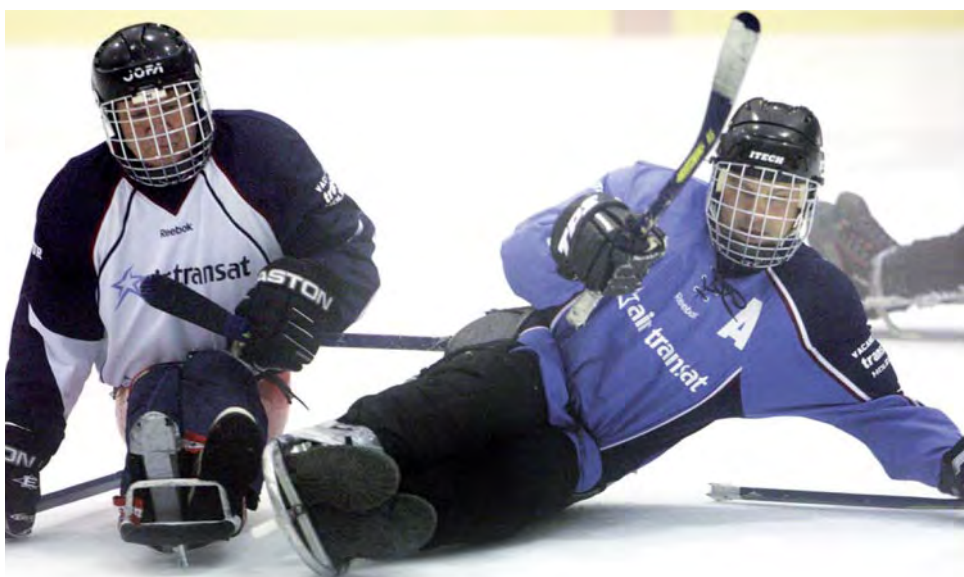
Le hockey sur luge a refait son apparition au Défi sportif en 2009.

L'an prochain, le Défi sportif sera l'hôte du Championnat du monde de hockey pour athlètes amputés . Un événement d'envergure à ne pas manquer.