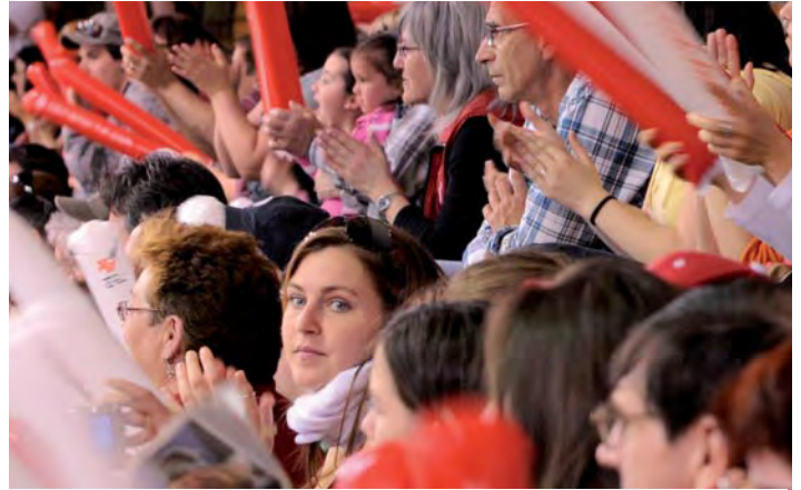
Une foule partisane animait le Centre Pierre-Charbonneau lors de la SUPER FINALE de basketball en fauteuil roulant.

L'ampleur actuelle du Défi sportif est attribuable en grande partie à une équipe dévouée de bénévoles. Près de 900