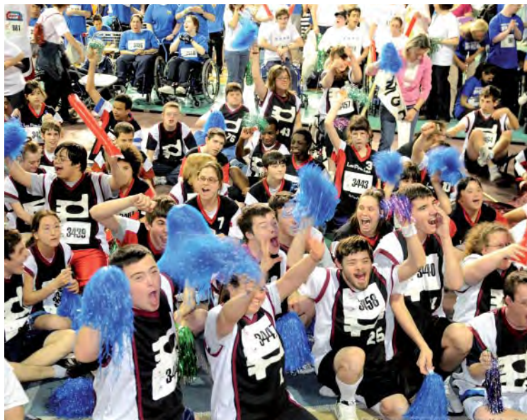
Un grand esprit de fête anime ces jeunes qui viennent compétitionner dans le cadre du Défi sportif.