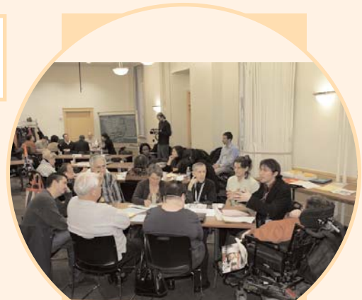
Ateliers lors de la journée de réflexion et de mobilisation du Projet LIENS le 26 novembre 2008.