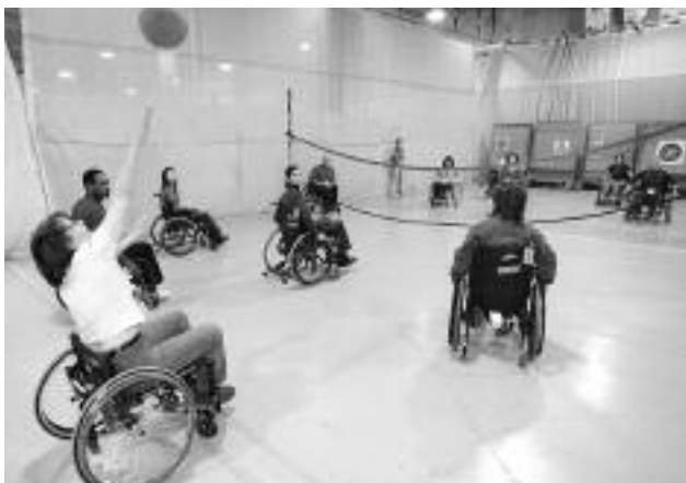
L'expérimentation du volleyball en fauteuil roulant .

Cette journée, organisée conjointement par l'Association des établissements en déficience physique du Québec (AERDPQ) et le Défi sportif, a été