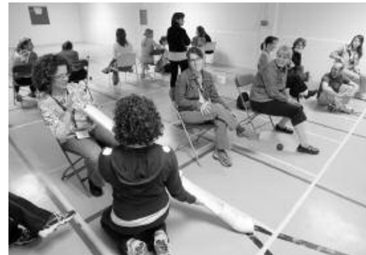
Les participants ont pu connaître les rudiments du boccia.

Un moment toujours aussi touchant pour les participants est d'assister à la remise des médailles du volet scolaire du Défi. En voyant les jeunes sportifs se diriger vers le podium sous les