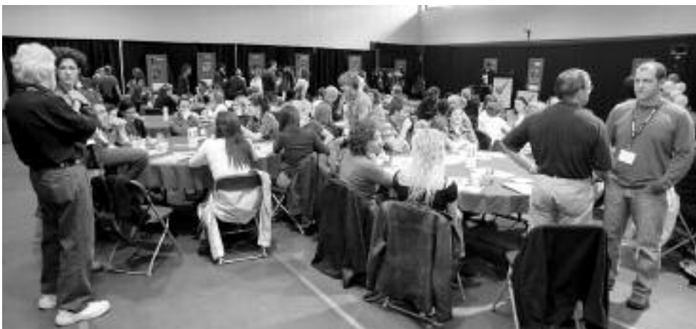
Plus de 130 intervenants de centres de réadaptation du Québec ont participé à la Journée de réadaptation.

Des idées, les participants en avaient à partager. Que ce soit d'inviter la Tournée des champions, de créer le Club du millionnaire, d'organiser un dîner Défi sportif, elles sont nombreuses les initiatives et les actions concrètes qui