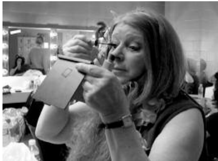
Séance de maquillage avant le lever du rideau. La concentration est de mise.