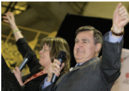
Lucien Bouchard, porte-parole d'honneur, et Monique Lefebvre, fondatrice du Défi sportif, lors de la cérémonie d'ouverture du 30 avril 2008.

Le 16 avril 2008 avait lieu un événement bien particulier pour lancer la campagne de presse du Défi sportif. Au Complexe Desjardins, Lucien Bouchard, porte-parole d'honneur du 25 e Défi sportif, a donné le coup d'envoi d'une partie de démonstration de basketball en fauteuil roulant lors d'un point de presse fort couru. Au même moment, des démonstrations d'escrime et de boccia ont eu lieu dans différents lieux achalandés du centre-ville. Le matin, à l'heure de pointe, plus de 20 000 cartes postales invitant les gens à découvrir le sport adapté au Défi sportif ont été distribuées dans cinq stations de métro. Cette journée mémorable de lancement du 25 e Défi sportif a été rendue possible grâce aux investissements de la Ville de Montréal, de Loto-Québec ainsi qu'au soutien de la STM.